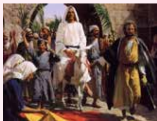
Ecco, a te viene il tuo re.